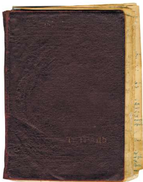
Общий вид фронтального дневника А.В. Петруляниса, политрука 133-й стрелковой роты 72-й стрелковой дивизии. 1941 г. ВОАНПИ. Ф. 9752. Оп. 1. Д. 129 General view of the front diary by A.V. Petrulyanis, political worker of the 133rd Infantry Company of the 72nd Infantry Division. 1941. VOANPI. F. 9752. Op. 1. D. 129